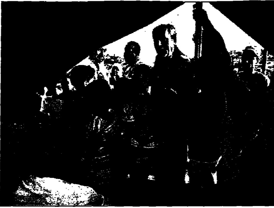
يواصل الجيش الإسرائيلي باستخدام هذا النوع من الممارسات في العمليات العسكرية.

عرفت يعلل ما ينبغي ان يطلع الامريكيون بالكونغرس على ان عرفات لا يزال ما يكفي في مسألة الازمات. واشترطت شروطا إضافية في محاولة لبعث روح جديدة في عملية السلام تحسب التسوية الامنية الفلسطينية على الفور.